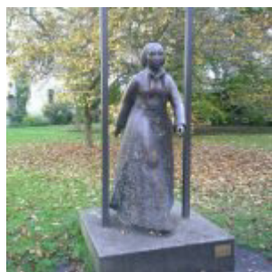
Professorsfrun i Wittenberg

Hon föddes kanske 1499, det var inte så viktigt att skriva ner allting då. Tidigt blev hon föräldralös och inte alltför fattiga släktingar betalade för att hon skulle få en fin uppfostran.