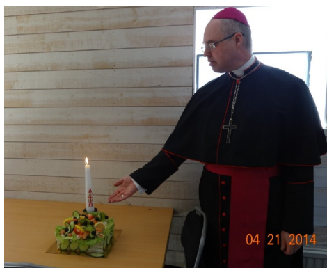
Biskopen vid den väldekorerade smörgåstårtan.