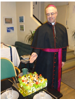
Smörgåstårten av ej så ringa storlek som ett cafe i Fruängen skapat. Julgåvor utdelas.