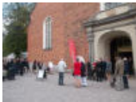
Minglet utanför domkyrkan i Strängnäs efter installationsgudstjänsten.