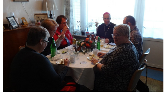
Glatt gäng intar måltiden efter mässan.