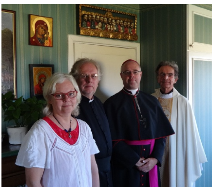
Gemensamt fotografi efter söndags Taizemässa. Lördagens mässa.