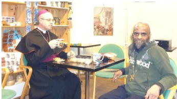
Kafferep i Proklamakapellet, Gudsföderskans beskydds församling.

Emaus Husförsamling i Gnarp firade gudstjänst på eftermiddagen i annandags påsk som traditionen är för denna församling.. St Fransiscus och Gudsfördeskans beskydds församling firade annandag påsk tillsammans i St Fransiscus kapellet, titta på deras sida under församlingar/medarbetare.