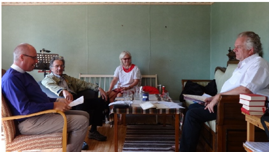
Möte och samtal igång.

På lördagen firades det mässa i Sankt Markuskapell i Norrgimma och på söndagen avslutade vi mötet med mässa i Taizeanda i Emaus huskapell.