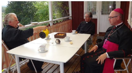
Kvällskaffe på verandan i Norrgimma.