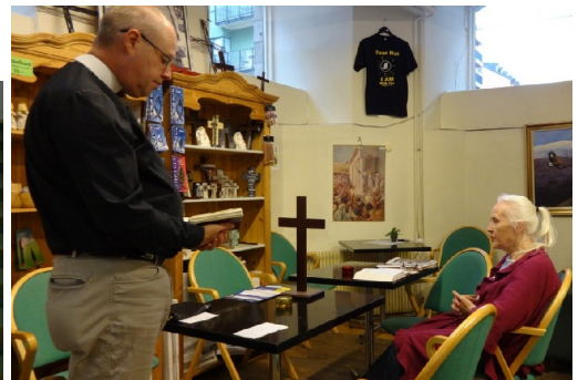
Kvällskaffe efter mässan den 20 augusti.