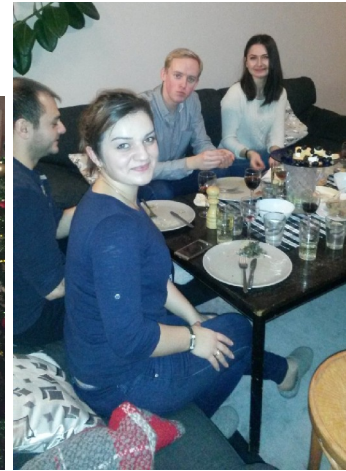
Kaffe med dopp.